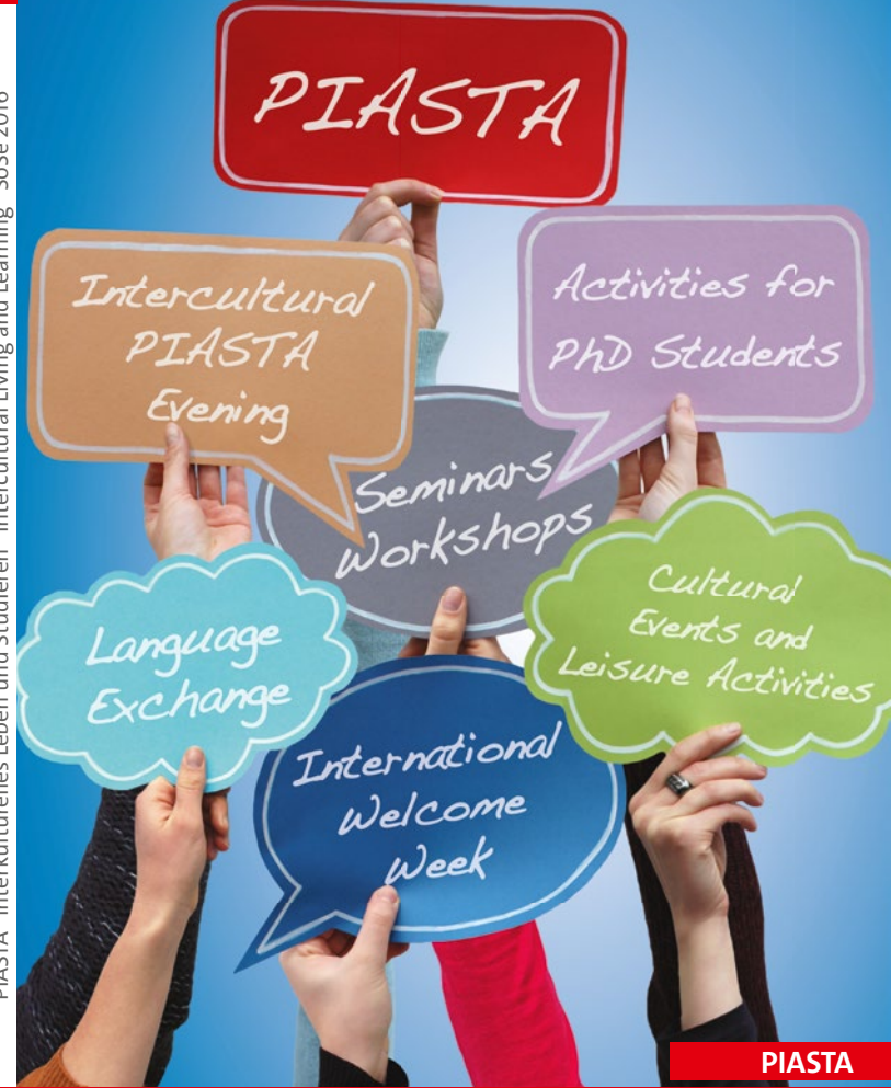
PIASTA - Interkulturelles Leben und Studieren - Intercultural Living and Learning - SoSe 2016