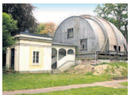
Architekt Albert Erbe baute die Sternwarte im Neo-Barock