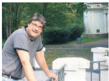
Professor Peter Hauschildt, Leiter der Sternwarte

Im nächsten Jahr feiert die Bergedorfer Sternwarte ihr 100-jähriges Bestehen. Noch steht das Programm in seinen Einzelheiten nicht fest. Aber neben einem Festakt und einem Tag der offenen Tür wird es „100 Stunden beobachten“ geben, das im Internet verfolgt werden kann. Die Fachwelt wird sich zu einer Tagung einfinden.