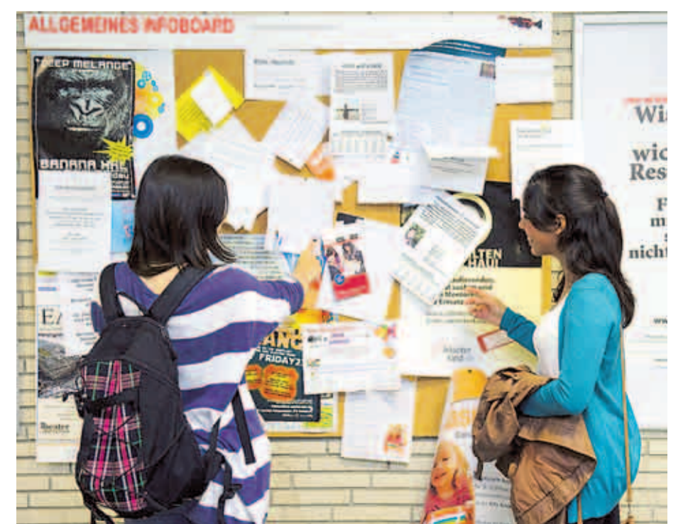
Hilfreich und informativ: das Schwarze Brett im Philosophenturm

Mit 600 Euro monatlich werden die AstA-Vorsitzenden und die Referenten entlohnt. „Damit kaufen wir uns tatsächlich die Leute frei“, sagt David, „ein Job neben dem Studium und dem AstA ist eigentlich nicht machbar.“ Mitmachen kann übrigens jeder, Möglichkeiten gibt es viele. Auch eine projektgebundene Mitarbeit ist immer möglich. „Wer eine Idee für eine tolle Aktion hat, kann jeder Zeit vorbeischaun und Vorschläge machen. Unsere Tür steht immer offen“, sagt Luise.