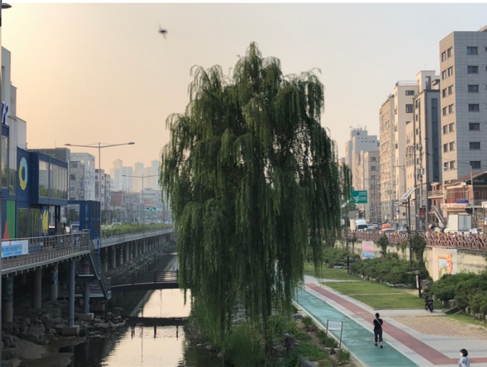
Spaziergang durch Sillim (ein Viertel nahe der Uni)