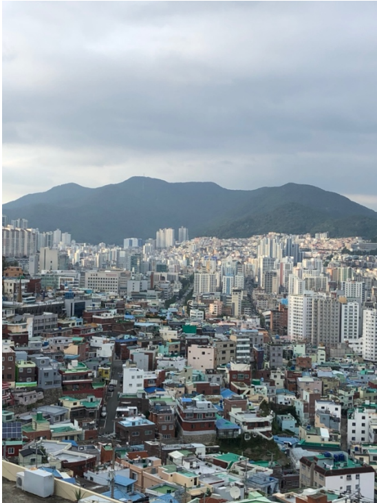
Busan Gamcheon Culture Village