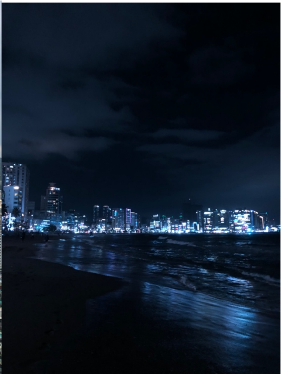
Busan Gwangalli Beach bei Nacht