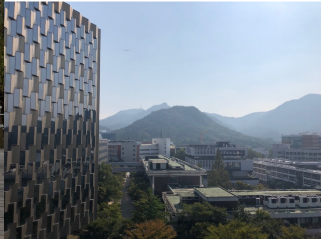
Die große Campus Bibliothek mit Blick auf die Berge