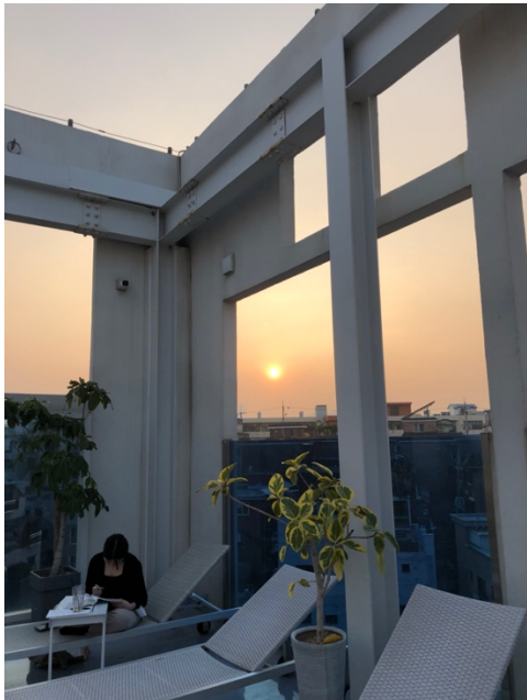
Eins der 1000 wunderschönen Cafés in Seoul