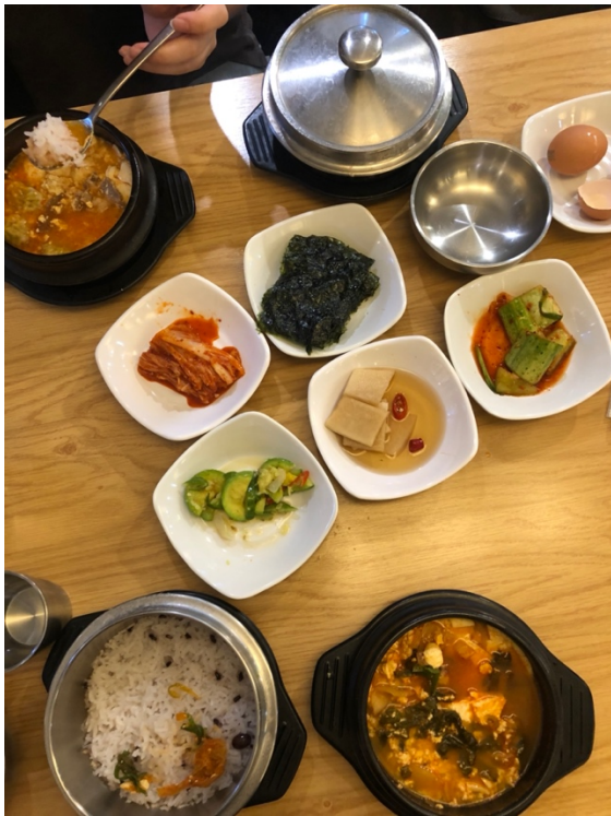
Leckere Kimchi-Stews (Jjigae) mit Side Dishes