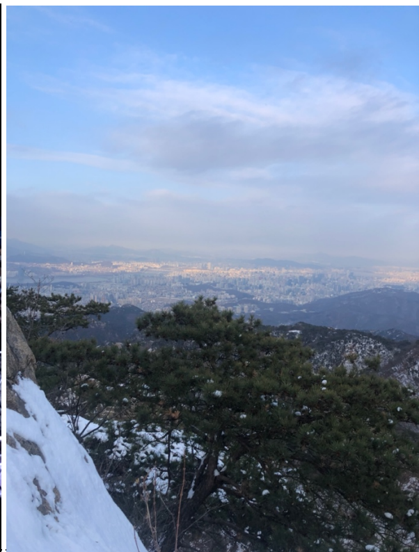
Ausblick vom Gwanaksan (Berg am Campus)