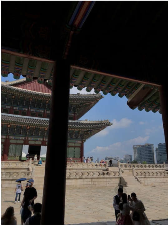
Gyeongbokgung Palast in Seoul