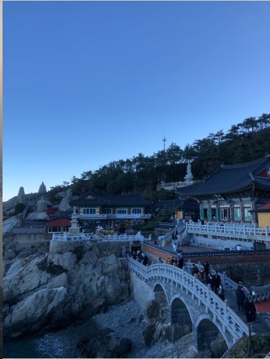
Blick vom Lotte Tower Seoul auf den Han-River Bekanntester&schönster Tempel in Busan (Haedong)