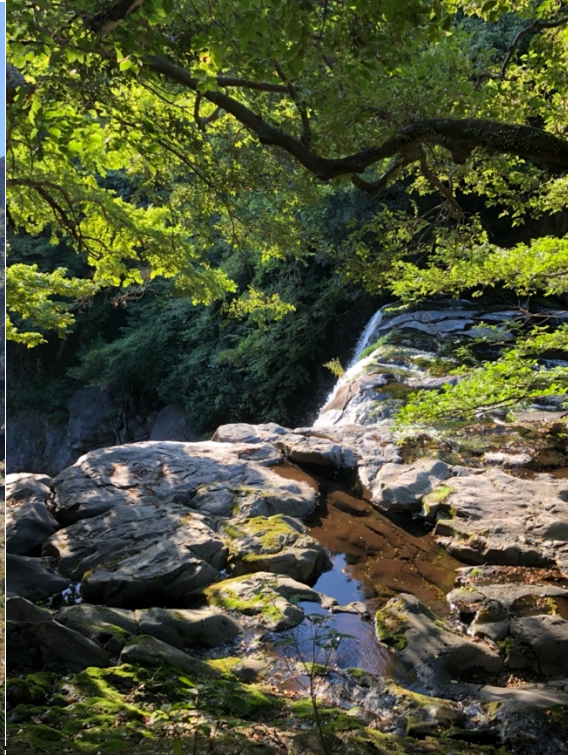
Wunderschöne Natur in Jeju