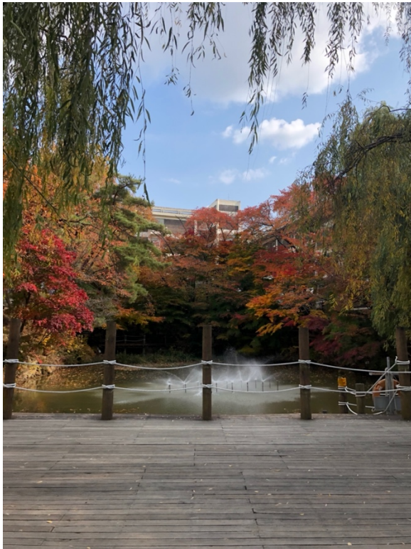
Campus im Herbst