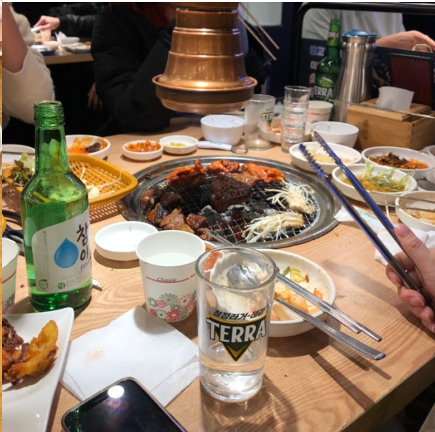
Korean BBQ mit Bier und Soju