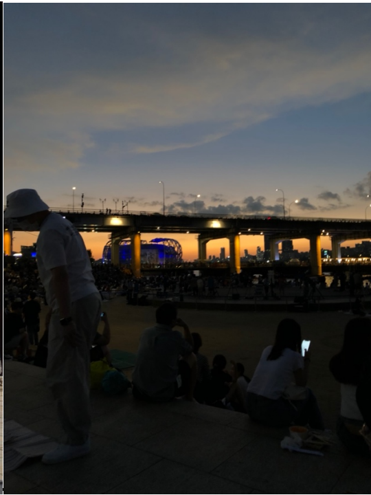
Picknick am Han-River