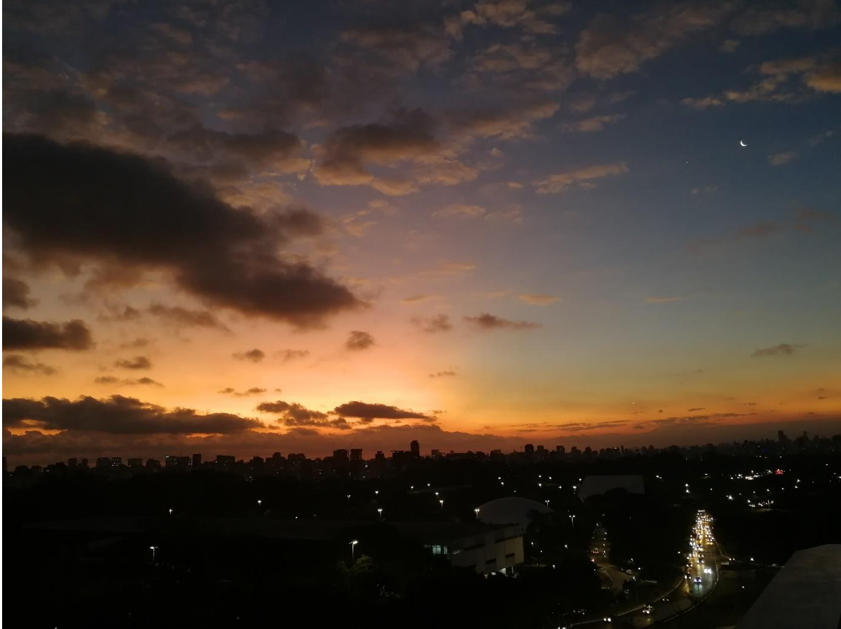
Bild 4: Sonnenuntergang in São Paulo auf der Dachterrasse des Museu de Arte Contemporânea der USP

Mein Alltag in São Paulo bestand aus einem Tag Vorlesungen am Campus Leste, zwei Nachmittagen mit Portugiesischunterricht sowie abseits davon Arbeit im Home Office. In meiner Freizeit stand vor allem das Forrótanzen im Vordergrund. Zudem habe ich mich mit Leuten getroffen, bin ab und an in Museen oder Ausstellungen oder in Parks gegangen, um so die Angebote von São Paulo zu genießen.